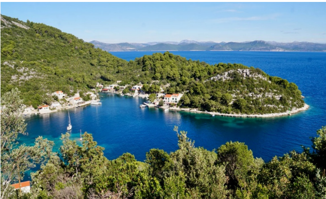
Die Bucht Okuklje in Norden von Mljet