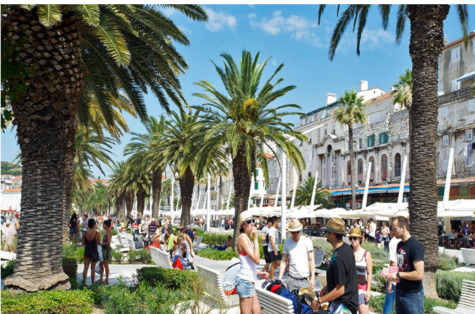
Die belebte Promenade von Split

Das Klima in Kroatien ist im April und Mai typischerweise mild und sonnig. Die Tagestemperaturen bewegen sich zwischen 16 und 25 Grad, nachts gehen die Werte auf 10 – 14 Grad zurück, was ein entspanntes Schlafen auf der Bodan ermöglicht.