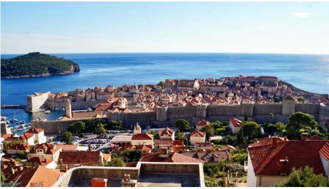
Die historische Altstadt von Dubrovnik